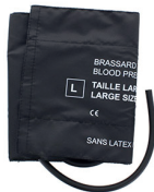
102TZC brassard adulte large, taille L