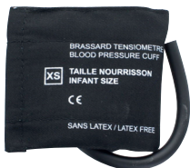
102TZB brassard enfant, taille S