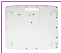
Pieds réglables : stabilité optimale