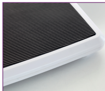
Tapis antidérapant et résistant à l'usure