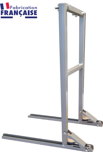
103KYA Pied support pour stations d'hygiène