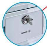
Serrure de porte (2 jeux de clés fournis)