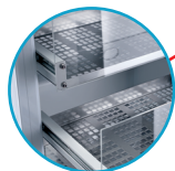
3 tiroirs métalliques