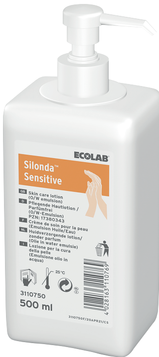
104ICB100 Flacon pompe de 500 ml