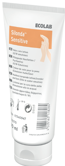
104ICA100 Tube de 100 ml