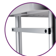
103LQB Lot de 4 rails universels