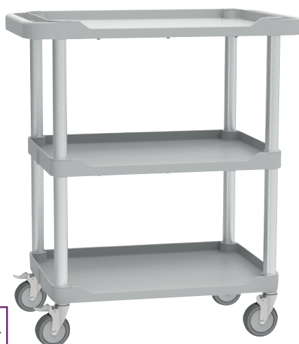
103LNB 3 plateaux