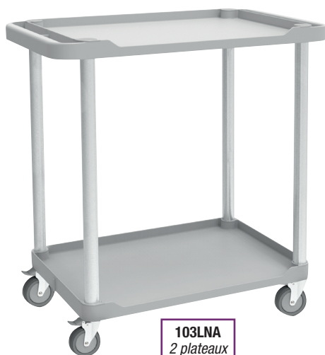
103LNA 2 plateaux