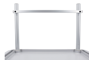
103LRA Portique universel