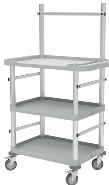
Exemple : modèle 3 plateaux avec options (lot de 4 butoirs + Portique + 4 rails universels)